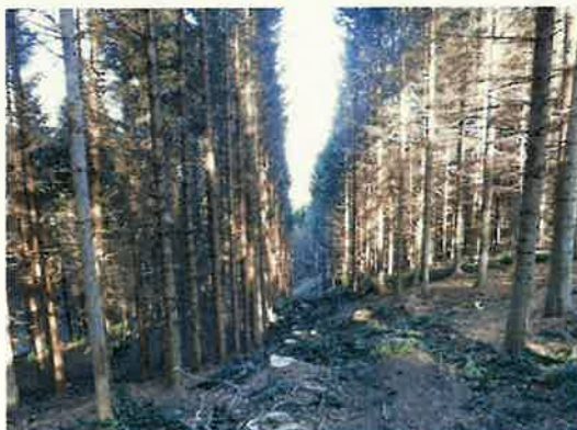
トドマツ列状間伐後