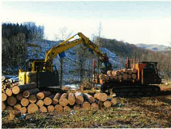
高性能林業機械導入の促進