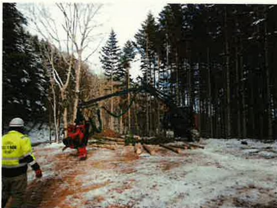
ICTハーベスタの運用実証