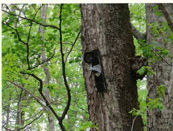
不法投棄監視カメラの設置