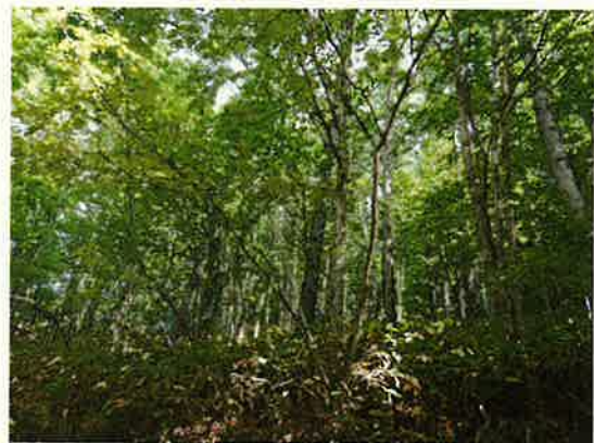
混交林化したカラマツ人工林