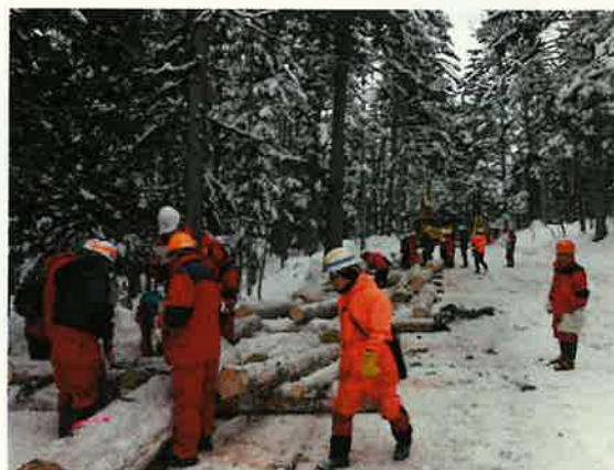
素材の品等格付研修会