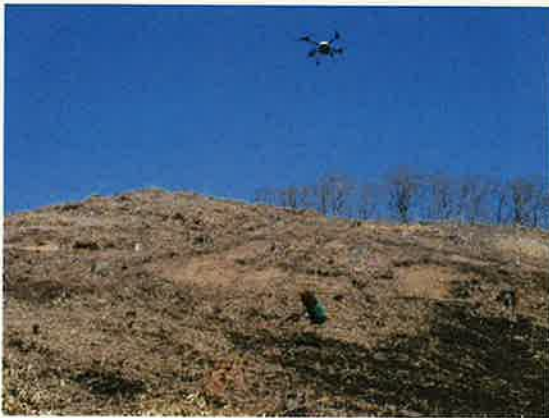
UAVIによる苗木運搬の試行