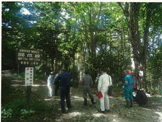
林業専用道開設箇所における現地検討会