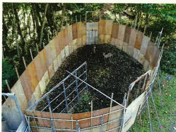
エゾシカ捕獲囲いワナ