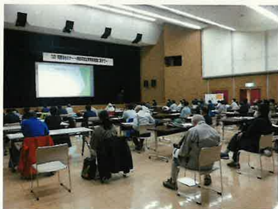
置戸照査法セミナー