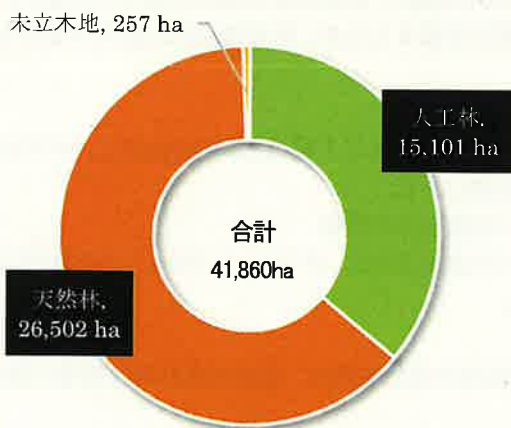
人工林・天然林別森林面積