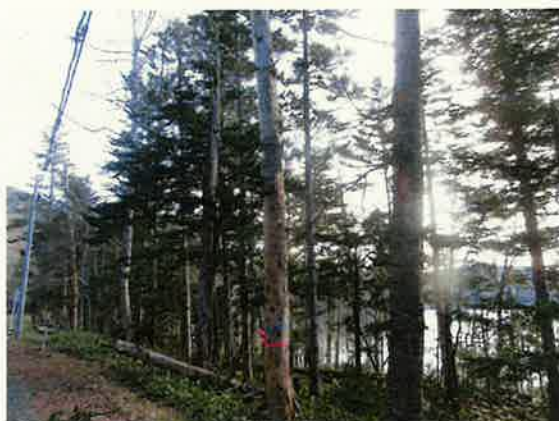
開放エリアの危険木確認