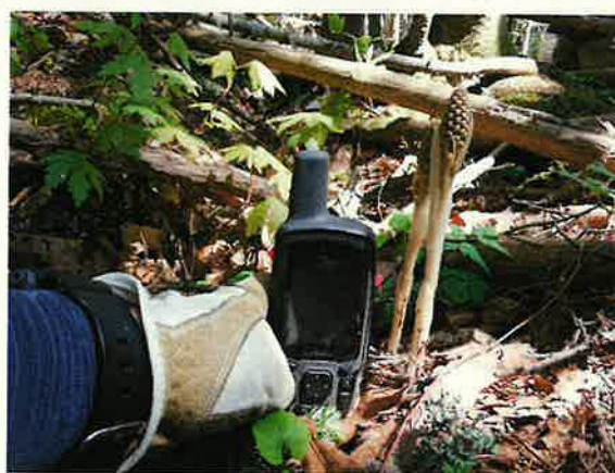
生物多様性保全の森林モニタリング調査(エゾサカネラン)