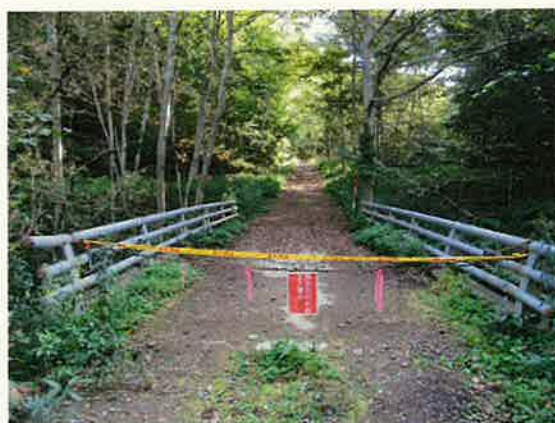
ヒグマ出没時の入林禁止措置