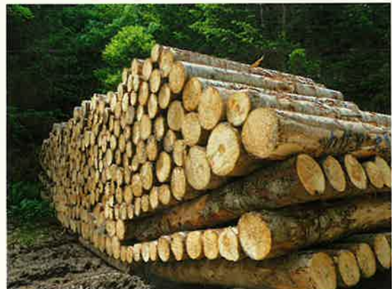
製材工場への原木供給