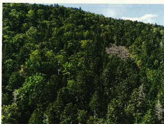
ナキウサギ生息アカエゾマツ保護林とガレ場