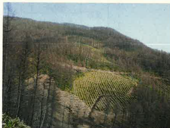
カラマツヤツバキクイムシ被災地の復旧状況