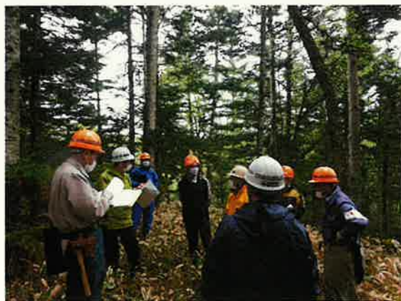
木材需要把握のための現地検討会