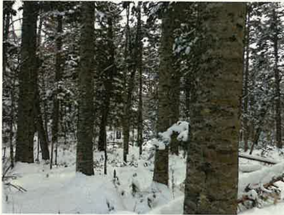
天然林間伐計画地