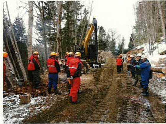
労働安全パトロール