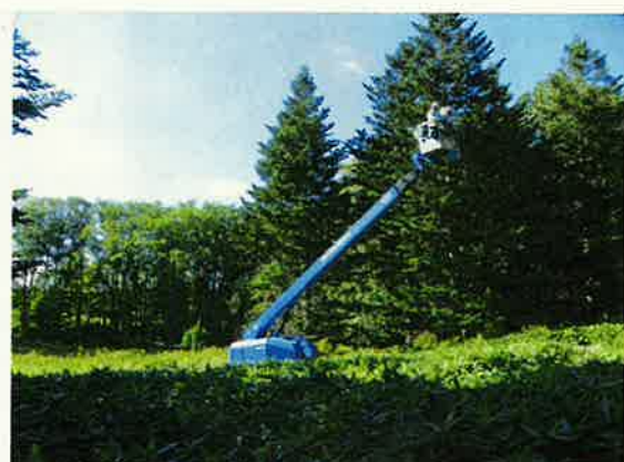
高所作業車による球果採取(訓子府採種園)