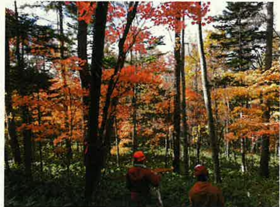
置戸照査法試験林での伐採木調査