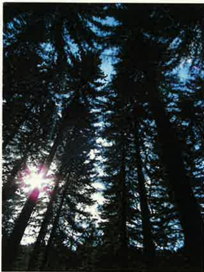
若松アカエゾマツ人工林(北見市指定保存樹)

林道などの路網については、森林の整備・管理に不可欠であることから、効率的かつ効果的な配置となるよう計画的な開設、補修を図ります。