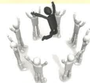
大勢の人が回復しています