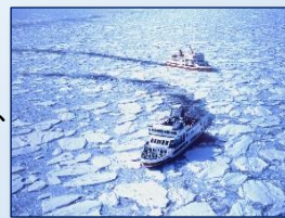
「流氷観光砕氷船おーろら」と「流氷」

オホーツク流氷館、博物館網走監獄、 能取岬、流氷観光砕氷船おーろら、 モヨロ貝塚