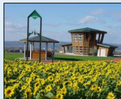
朝日ヶ丘公園と ひまわり畑