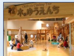
森の美術館「木夢(こむ)」