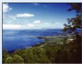
サロマ湖展望台からのパノラマ