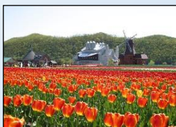
チューリップ公園

チューリップ公園 ファミリー愛ランドYOU(道の駅) かみゆうべつ温泉チューリップの湯(道の駅)、龍宮台展望公園