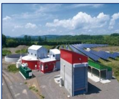
興部北興 バイオガスプラント