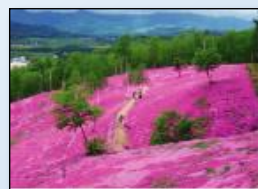
芝ざくら滝上公園