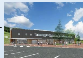
遠軽 森のオホーツク (イメージ図)

太陽の丘えんがる公園、がんばろ岩 白滝ジオパーク、埋蔵文化財センター 森林公園いこいの森、大平高原、 山彦の滝、ロックバレースキー場、 ちゃちゃワールド