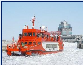
「ガリンコ号Ⅱ」とオホーツクタワー