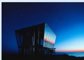
日の出岬展望台 「ラ・ルーナ」

日の出岬(海浜公園、キャンプ場) オホーツクオムイ温泉 (ホテル日の出岬) 日の出岬展望台「ラ・ルーナ」