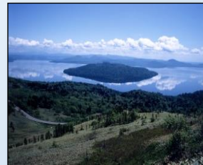
天下の絶景「美幌峠」

美幌豚醬まるまふ・ オホーツク焼「美幌窯」 おかず味噌・じゃがいも・ 小麦・ビート