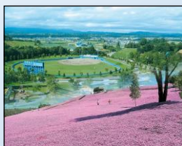
レクリエーション公園