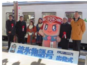
2018年の出発式の様子