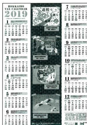
2019年 道税カレンダー