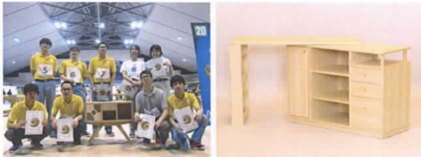
技能五輪全国大会入賞者