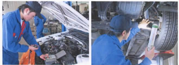
エンジンの点検・整備