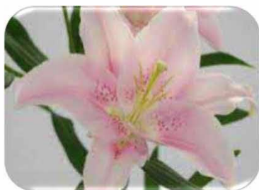
オリエンタルユリ