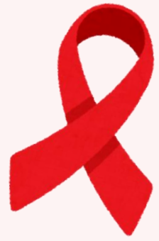
北海道のHIV感染者およびエイズ感染者数（新規）