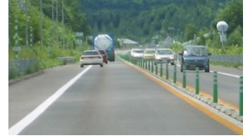
整備後 (旭川紋別自動車道)