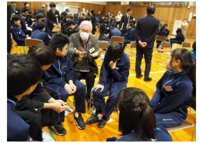
高校生、中学生、地元住民で地域の未来を考えるワークショップ (北海道常呂高等学校)

社会教育では、地域と学校がパートナーとして地域の課題解決に主体的に参画する人材を育成するため、学校の地域連携組織の機能強化を図るとともに、地域の学校支援の取組や放課後の子どもの居場所づくりなどの活動が充実するよう努めています。