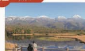
知床五湖 Shiretoko Five Lakes