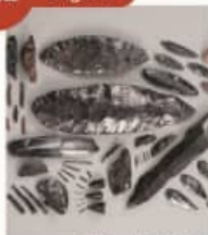
黒曜石 Obsidian