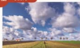
メルヘンの丘 Hill of Fairy Tales