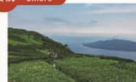
屈斜路カルデラトレイル Kussharo Caldera Trail