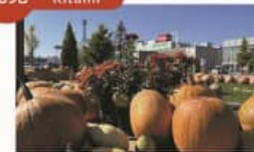
北見秋祭 Kitami Autumn Festival