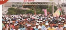
サロマ湖100kmウルトラマラソン Lake Saroma 100 km Ultramarathon