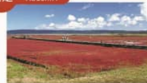
サンゴ草 Coral Grass