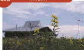
ワッカ原生花園 Wakka Primeval Flower Garden