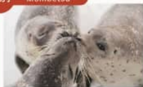
アザラシランド Seal Land