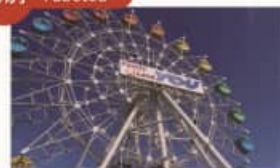
Family 愛 Land YOU Family Love Land You