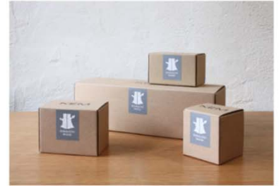
自社製品（例：製品パッケージへの印字）