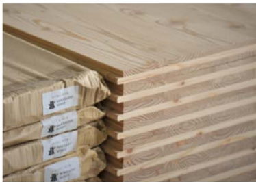
自社製品（例：製品ラベルへの印字）