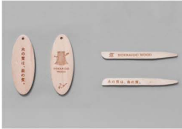
販促グッズ（例：木製キーホルダー、葉子楊枝）

道産木材製品の魅力を伝えたいという思いをもつ企業や、応援してくださる方などが、様々な場面でロゴを使用し、HOKKAIDO WOODを広めています。