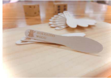
自社製品（例：製品への印字）