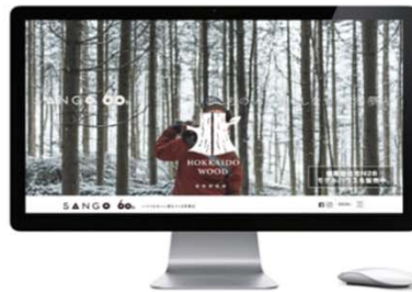
WEB上の使用（例：自社サイトでの活用）