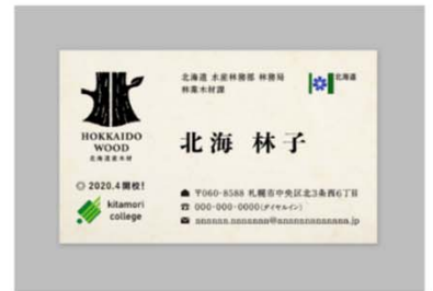
印刷物への使用（例：名刺）