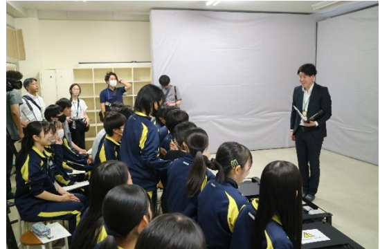
（R6実施（十勝管内幕別清陵高校）の様子）