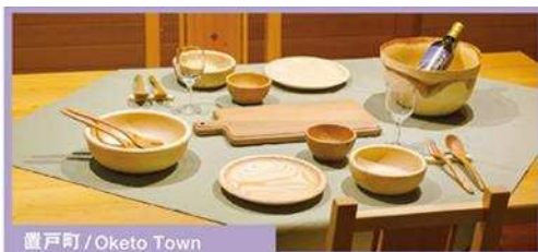
置戸町 / Oketo Town

クイズの問題、答えなど、ネタバレになるような写真や動画をブログやSNSなどのインターネット上で公開することはおやめください。個人情報の取扱いなど詳細については、HPをご確認ください。本キャンペーンの参加による損害については一切の責任は負いません。