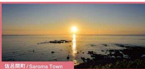
佐呂間町 / Saroma Town