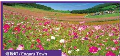
遠軽町 / Engaru Town