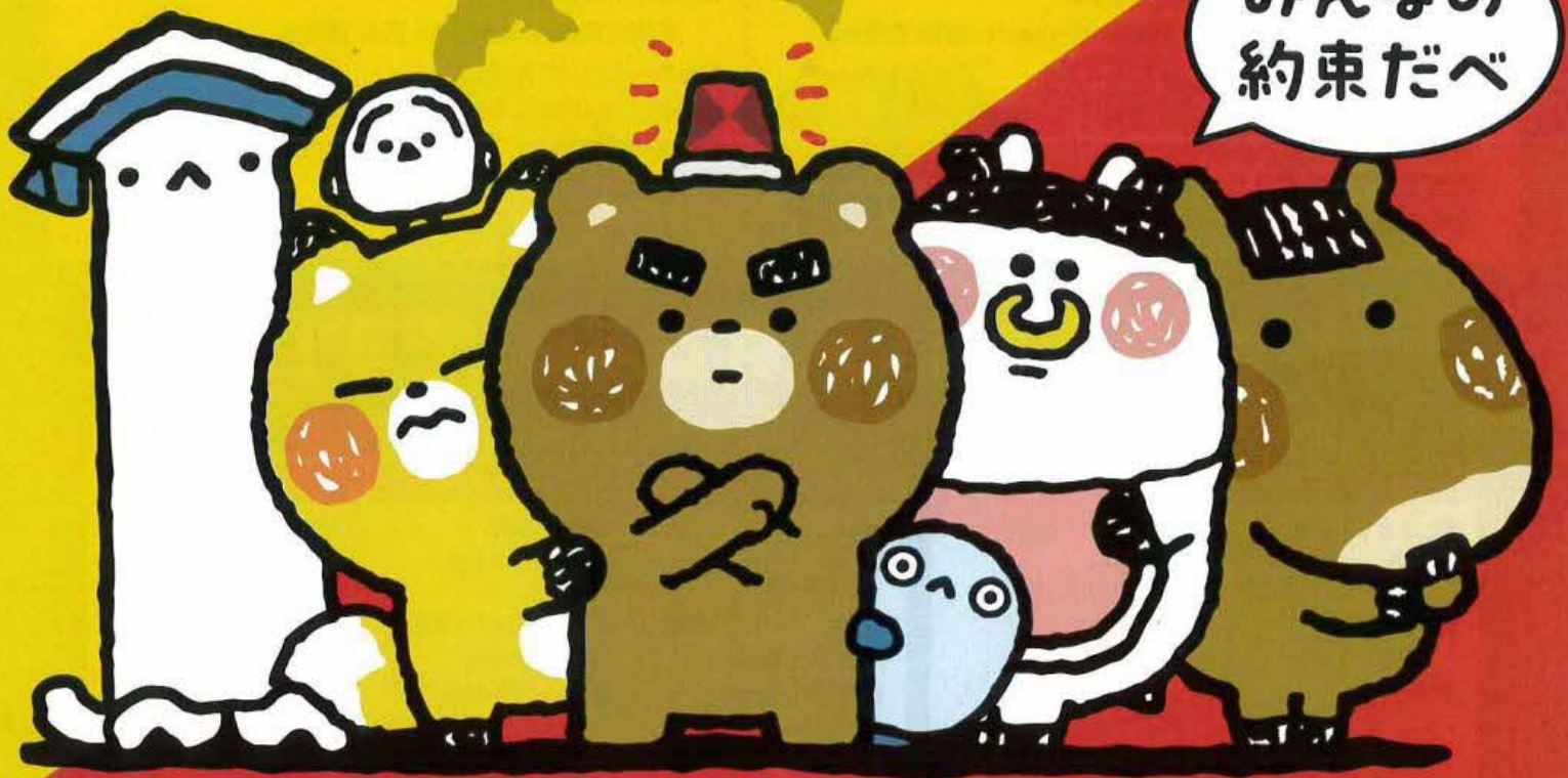
飲酒運転根絶アンバサダー「やべーべや」と仲間たち