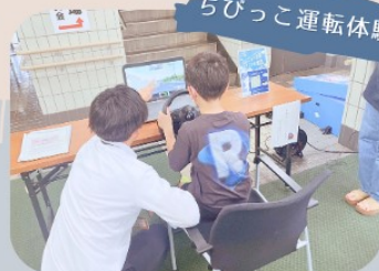
ちびっこ運転体験