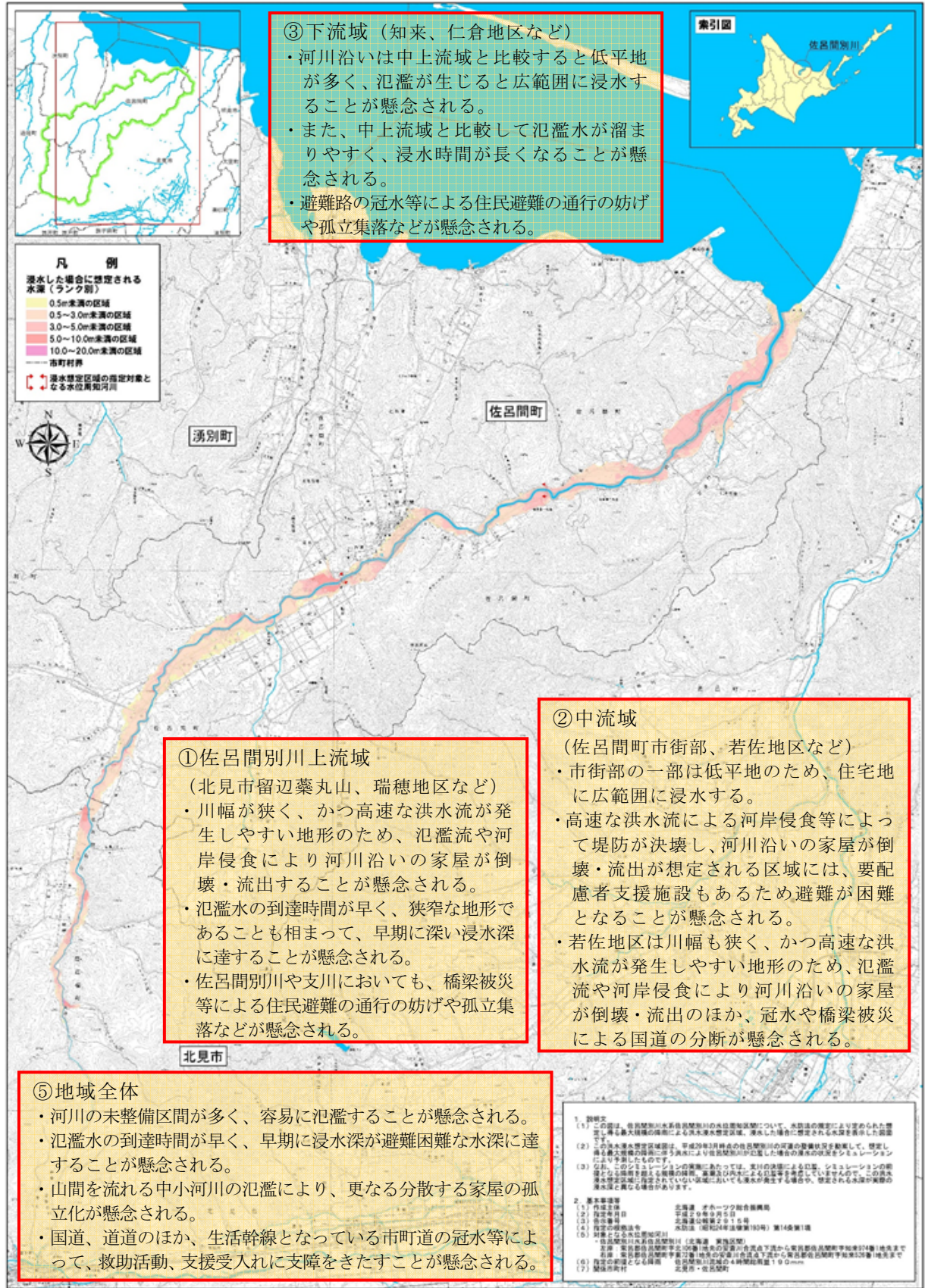
佐呂間別川水系佐呂間別川 洪水浸水想定区域図(想定最大規模)