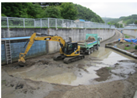
溪流保全工 河道掘削