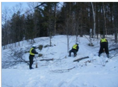
法面の維持管理業務