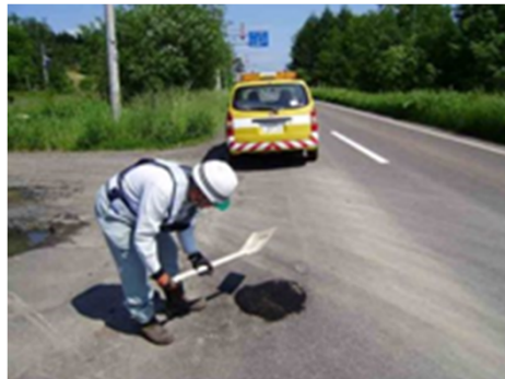
公物パトロール業務