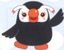
北方領土のイメージキャラクター えとぴりかの「エリカちゃん」