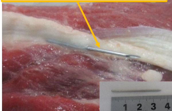
今回発見された注射針

9月1日、管内と畜場で食肉中に長さ約37mmの破損注射針の残留を認めた事例がありました。注射針は複数頭の乳廃用牛がと畜された後の加工処理中に金属探知工程で発見され、個体の特定はされませんでした。管内での治療時に注射針の破損・残留が生じた可能性があります。