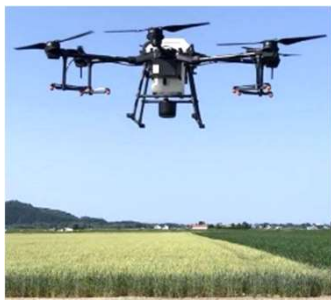
表 無人航空機による作業時間（面積：1.79ha）

遠隔操作又は自動操縦により飛行させることができる無人航空機（200g未満のものを除く）